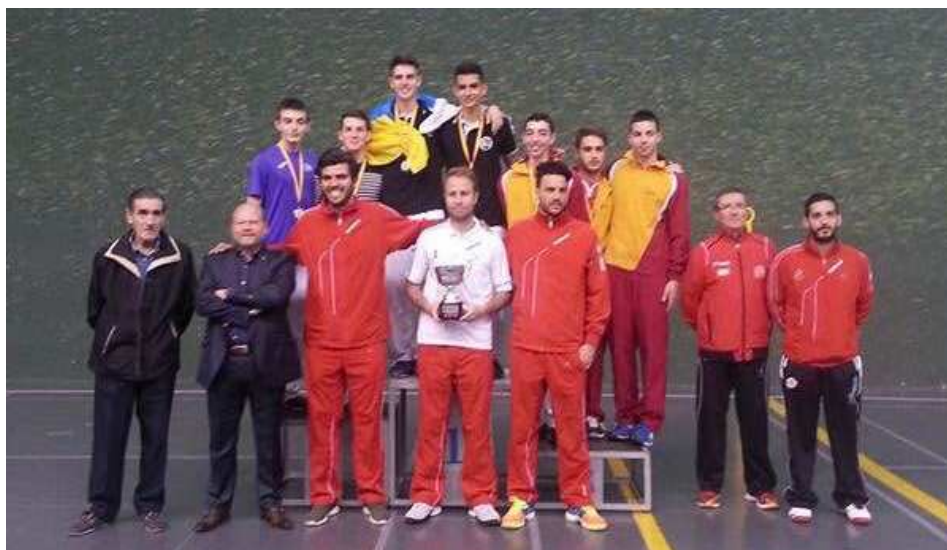
Pódium Frontenis Olímpico Masculino. Canarias ORO. Valencia PLATA.. Castilla y León BRONCE