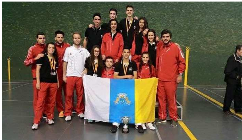
Selección Juvenil 2015 CANARIAS