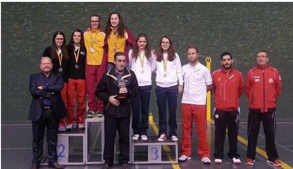
Podium Frontenis Olímpico Femenina parejas. Castilla y León ORO. Canarias PLATA. Valencia BRONCE