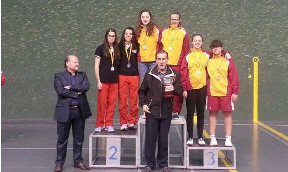
Podium Paleta Goma Femenina parejas. Castilla y León ORO y BRONCE. Canarias PLATA