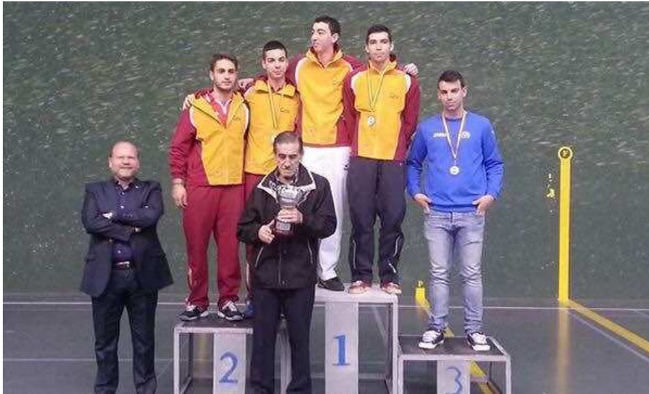
Pódium Paleta Goma Masculina Individual. Castilla y León ORO y PLATA. Valencia BRONCE