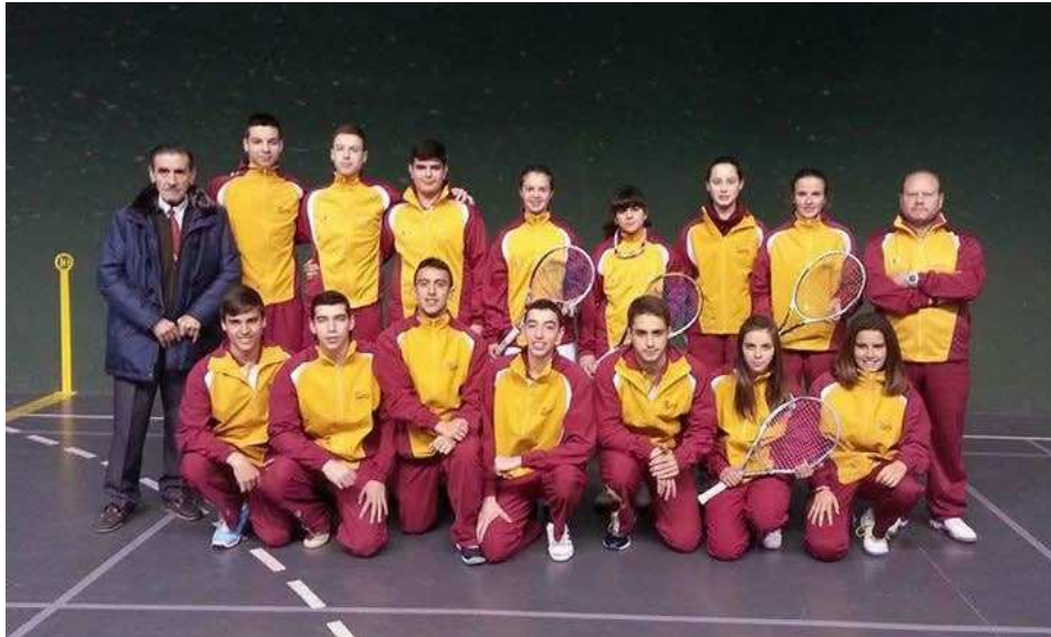
Selección juvenil 2015 CASTILLA Y LEÓN