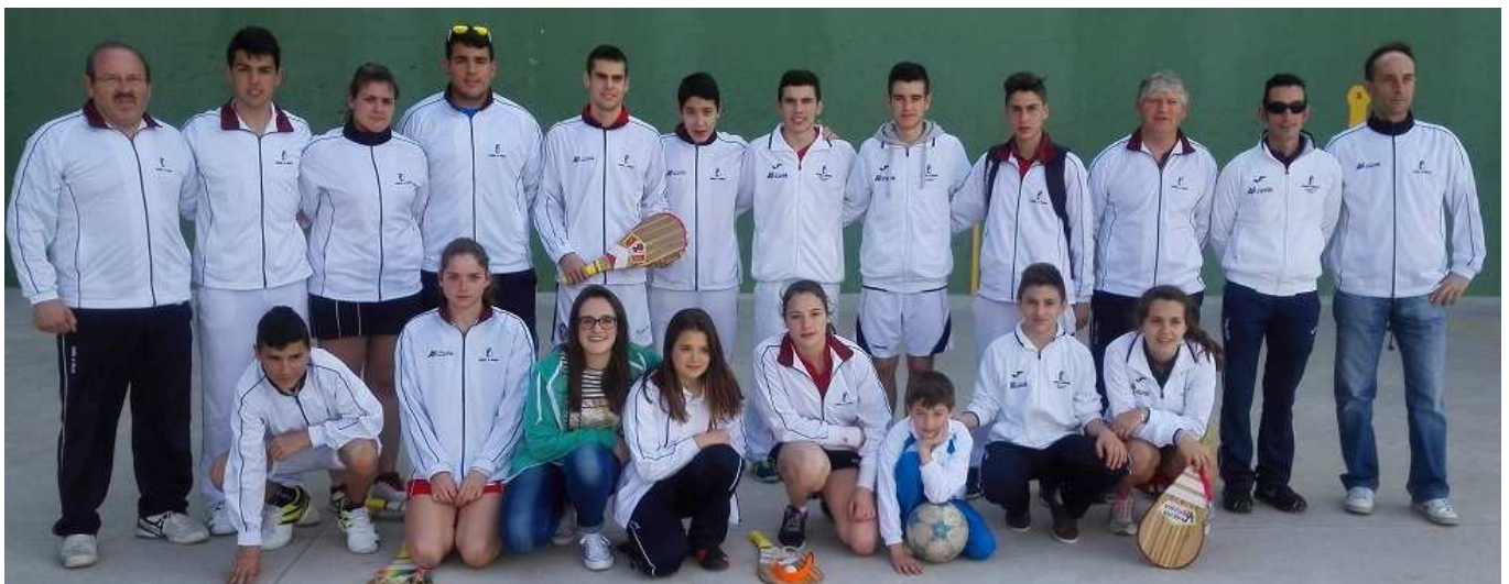
Selección juvenil 2015 de Castilla la Mancha