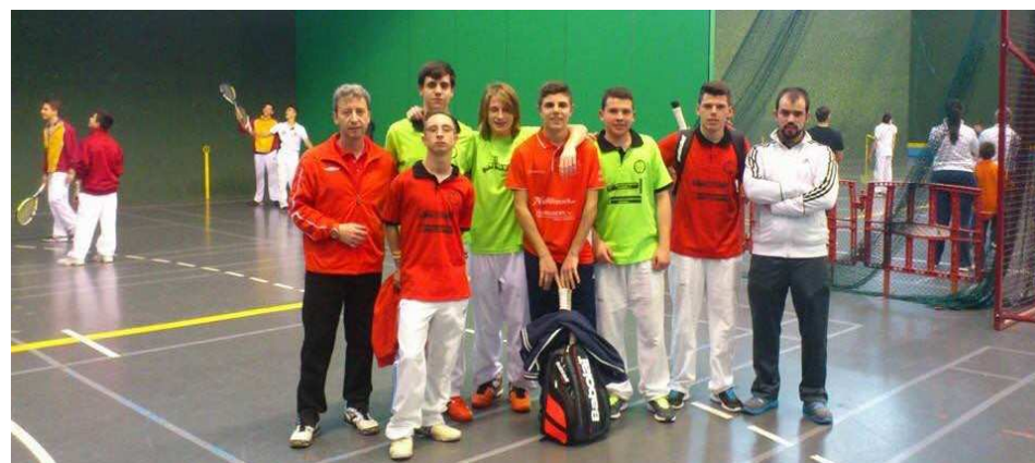
Selección Juvenil 2015 ANDALUCIA