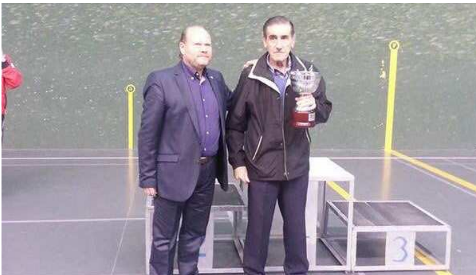
Castilla y León CAMPEONA del campeonato de España juvenil de Frontón a 30 metros