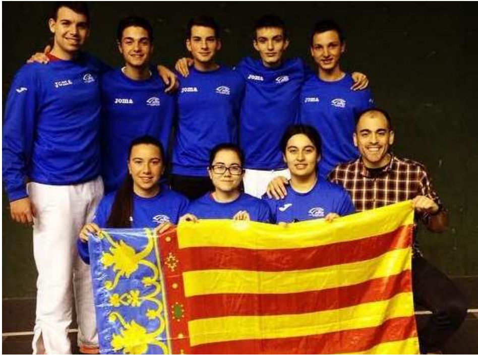
Selección juvenil 2015 Comunidad Valenciana