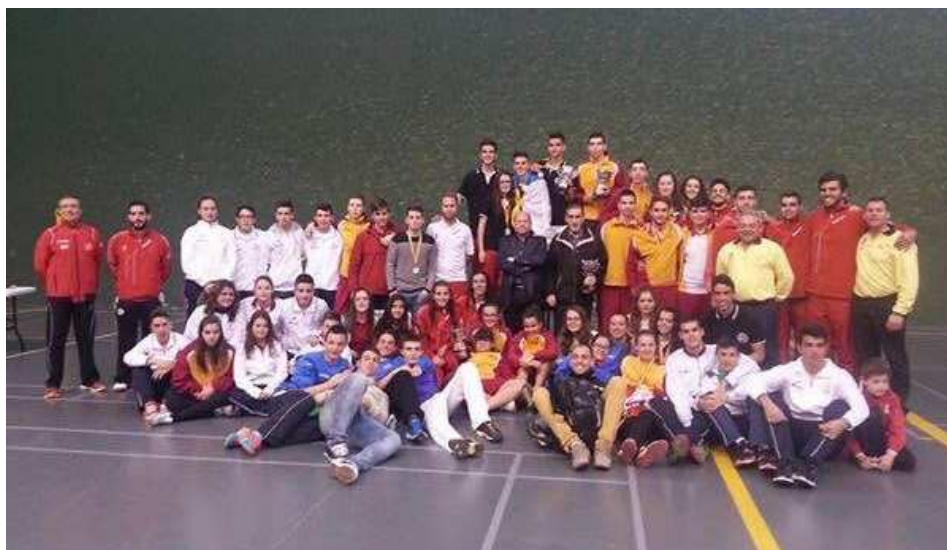
Foto de grupo