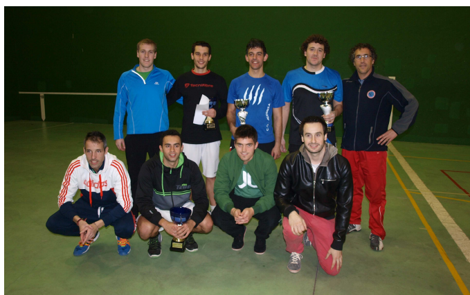
Torneo Foto de grupo con los cuatro primeros clasificados