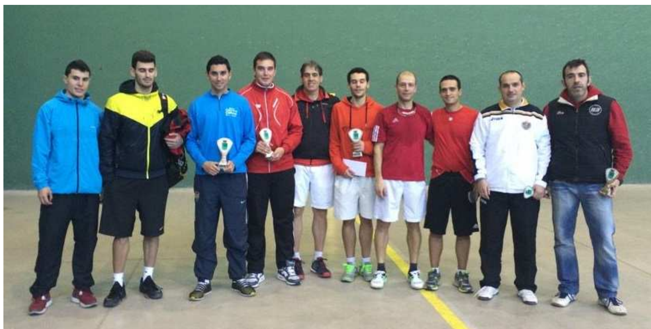
Torneo de Navidad por Parejas. Foto de los premiados