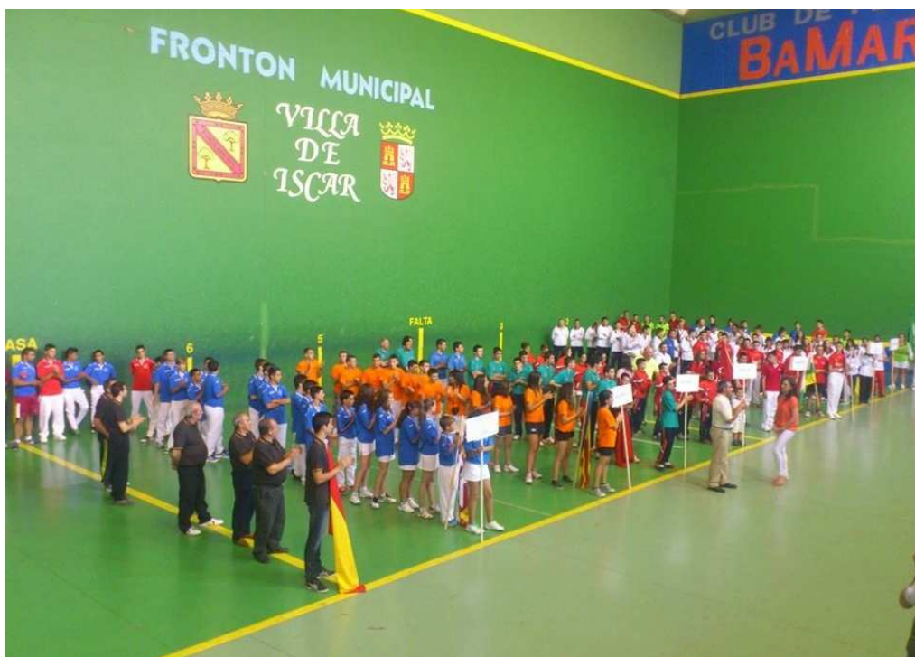
Presentación del Campeonato de España de Edad Escolar 2014