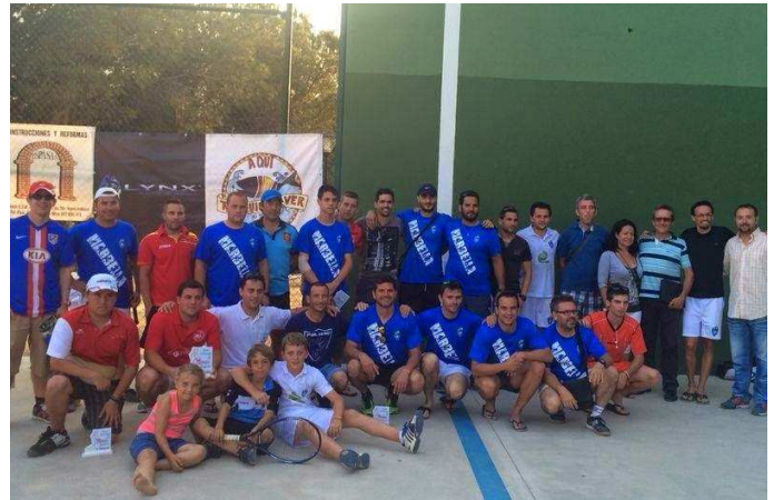
Foto de grupo con todos los participantes, buen nivel hay en el Frontenis andaluz, aun les queda mucho para llegar al nivel de otras comunidades autónomas como Madrid o Valencia pero van progresando bastante, tienen muy buenos jóvenes, gran presente y futuro, dominan muy bien todos los jugadores la rapidísima y complicada bola Ozone Swift.

alta, el joven zaguero rival tenía uno de los mejores revéses jamás vistos, mataba muchas bolas y le faltaba regularidad pero en este partido estuvo muy acertado.