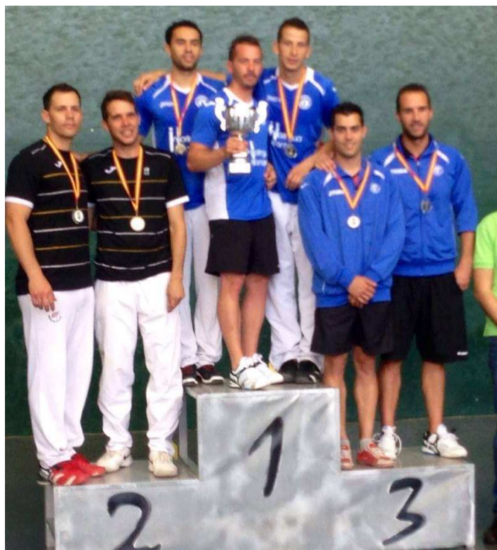
Pódium División de Honor.

CAMPEON DE ESPAÑA DE FRONTENIS PREOLIMPICO DIVISION DE HONOR