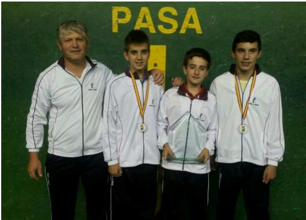
CAMPEON Infantil Masculino equipo de Castilla La Mancha