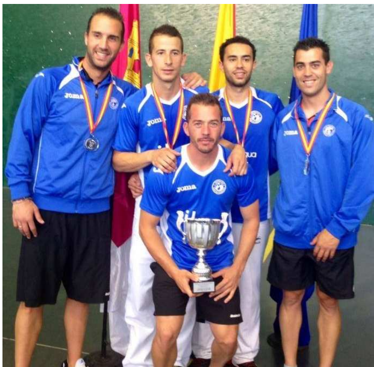
Club Frontenis Torre de Portacoeli

CAMPEON DE ESPAÑA DE FRONTENIS PREOLIMPICO DIVISION DE HONOR