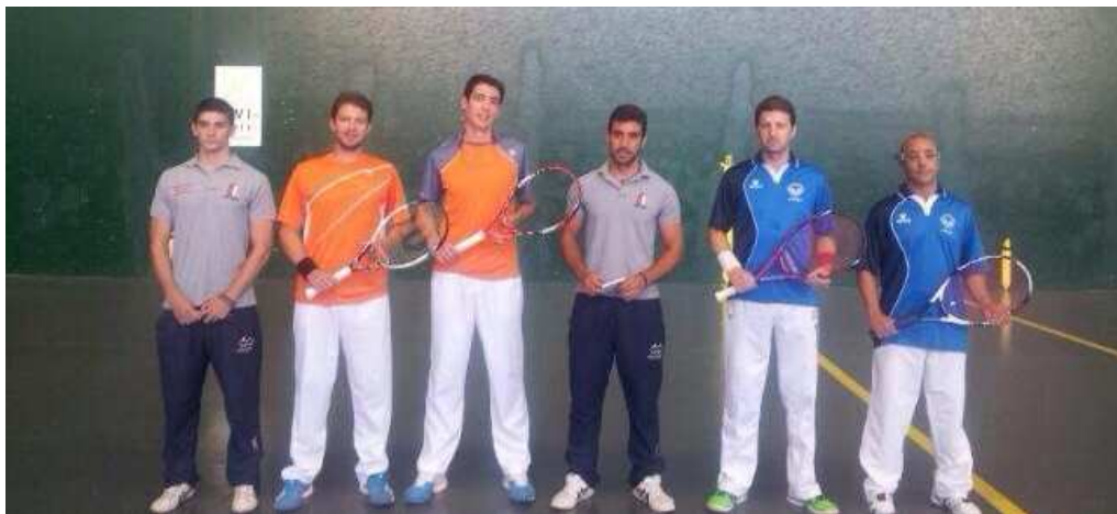
Finalistas de PRIMERA DIVISION Benicarló—Cheste A