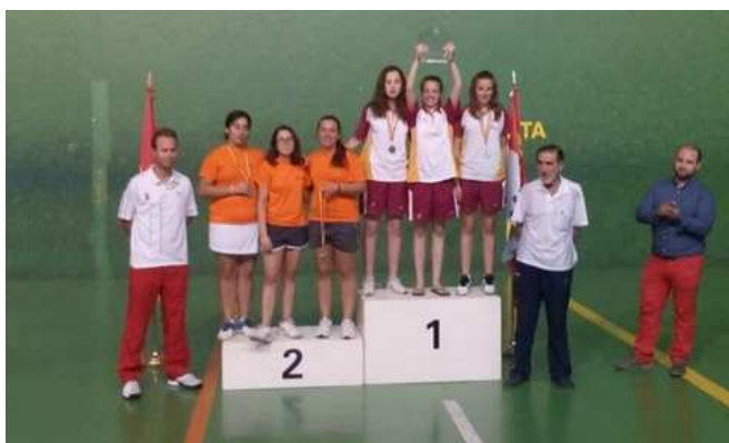
Pódium Frontenis Infantil Femenino