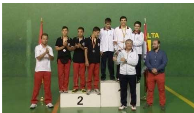
Pódium Frontenis Infantil Femenino