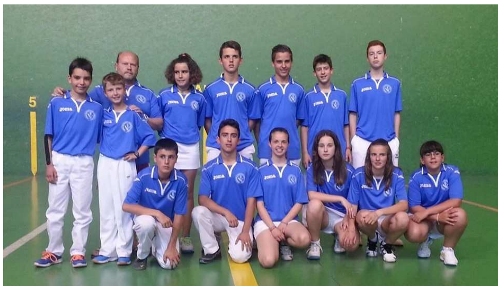
Castilla y León: Equipo CAMPEÓN del Campeonato de España de Edad Escolar 2014 celebrado en Iscar (Valladolid)