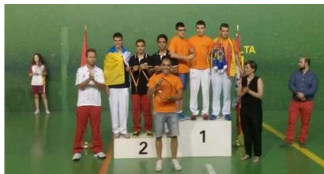
Pódium Frontenis Infantil Femenino