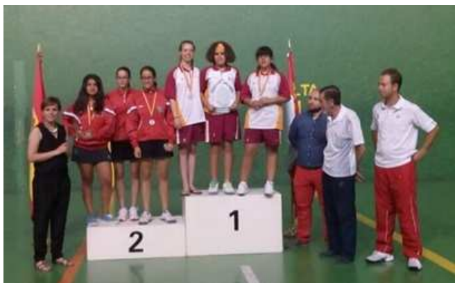
Pódium Frontenis Infantil Femenino