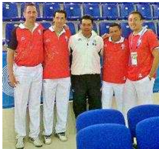
Podium Paleta Goma F30