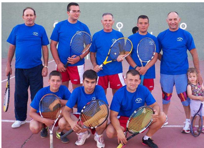
Participantes del Torneo