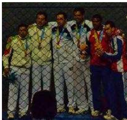
Podium Paleta Goma F30