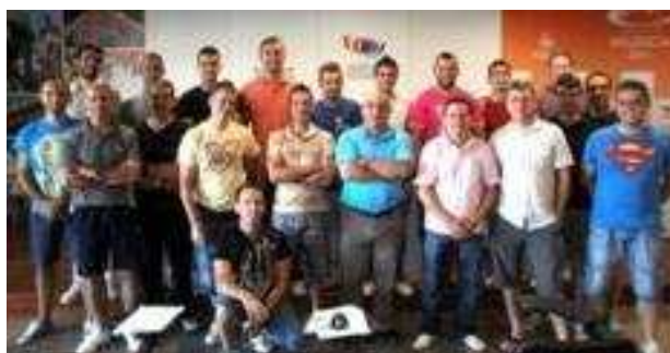
Curso de jueces en la Comunidad Valenciana