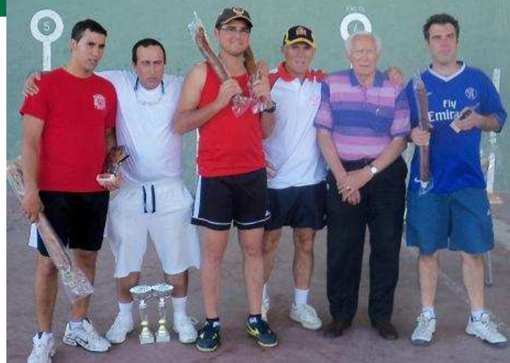
Premios segundo y tercer puesto con el alcalde