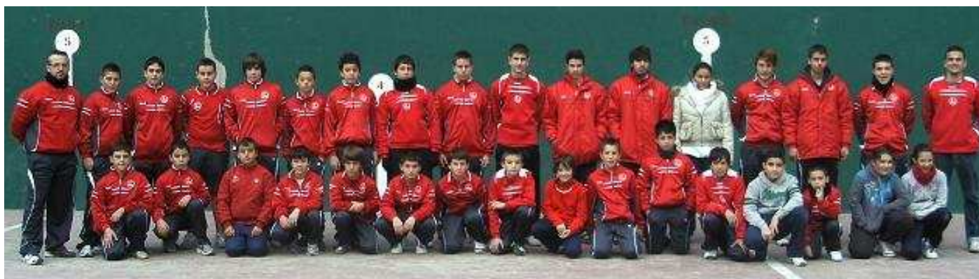
Escuela de Frontenis 2011 del Club Valenciano de Natación

Técnico de Frontenis del Club Valenciano de Natación