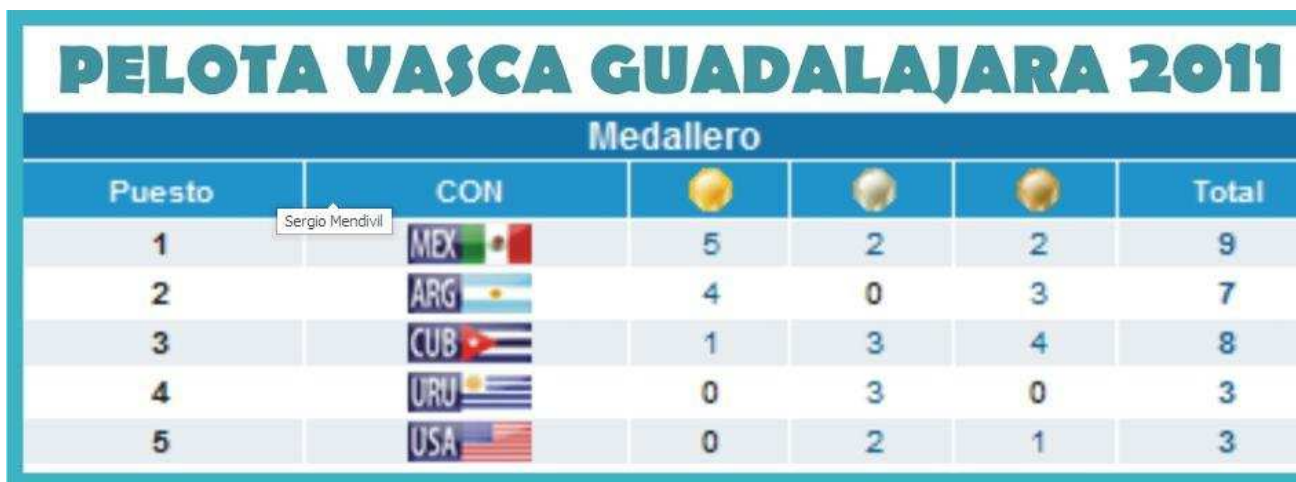
Medallero Modalidades Pelota Vasca