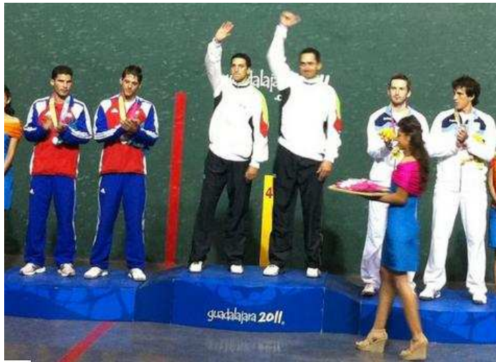
Podium Frontenis Masculino