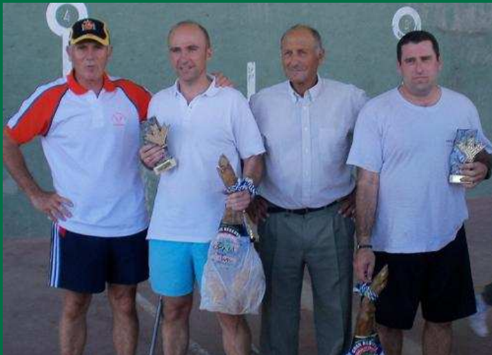
Campeones del Torneo el organizador y concejal