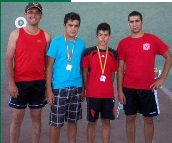
Entrega de premios Infantiles