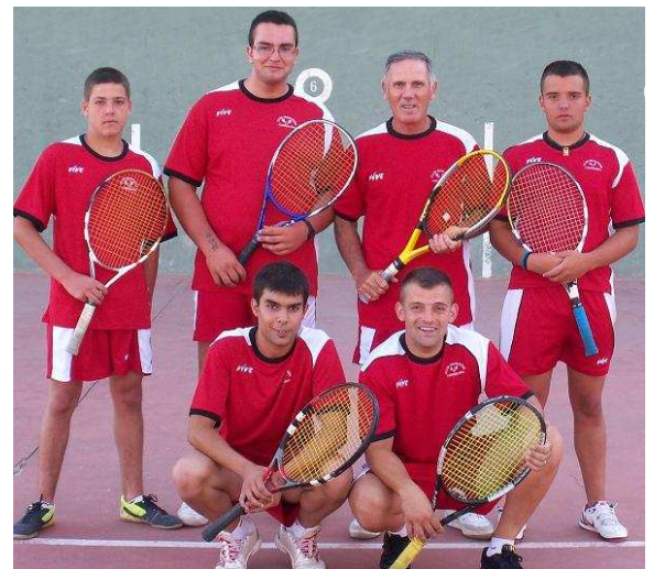
Torneo juvenil Aldeaseca de la Frontera