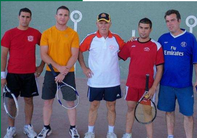
Tercer y cuarto puesto