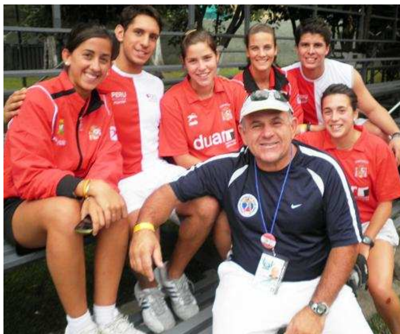
El equipo peruano con la delegación femenina de España