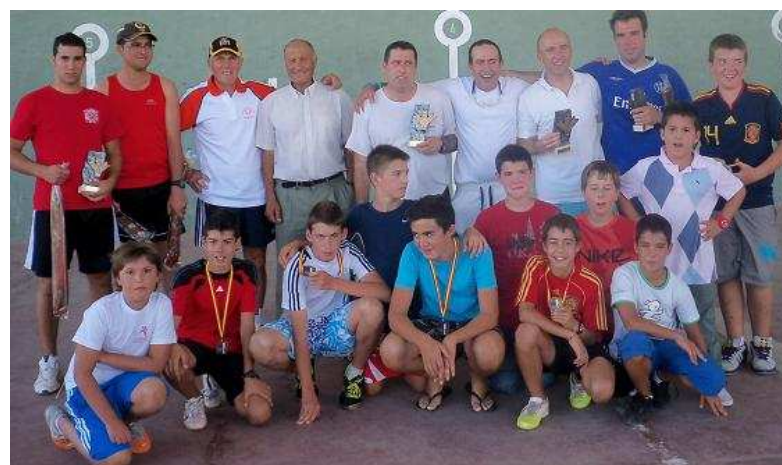
Foto de Familia