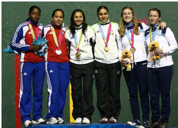
Podium Frontenis Femenino